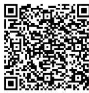
QR code koffiekopjes DOH

Met een enthousiaste, tijdelijke werkgroep is er al veel werk verricht om dit voor elkaar te krijgen. In onze PGV app zijn we een inzamelingsactie gestart voor donaties voor nieuwe koffiekopjes. Onder 'geven' vindt u een tabblad met de titel 'Nieuwe koffiekopjes voor De Open Hof' waar u kunt doneren. Ook via deze link en de afgebeelde QR code is dat mogelijk.