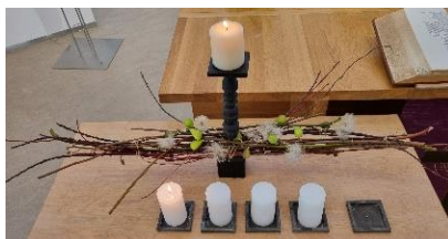
Schikking van 1 e advent

Water om te dopen, nieuw leven dat gaat komen we weten niet hoe, snel of langzaam rechtstreeks of via omwegen we weten dat het komt.