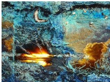
De vierde scheppingsdag