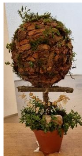
Schikking van vorige week, de 6 e zondag