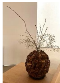
Schikking 1 e zondag

Trouw van God aan de aarde. Telkens opnieuw gecreëerd Goed genoeg.