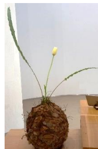
Schikking van vorige week de 4 e zondag