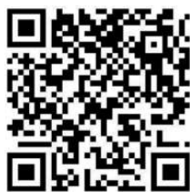
QR code - PGV